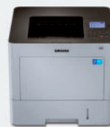
M4530ND (45 ppm)