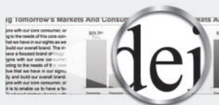
De-ICE (Integrated Cavity Effect)