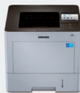
M4530NX (45 ppm)